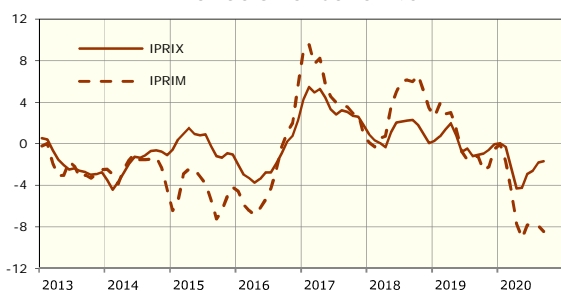
IPRIX E IPRIM variación anual en %