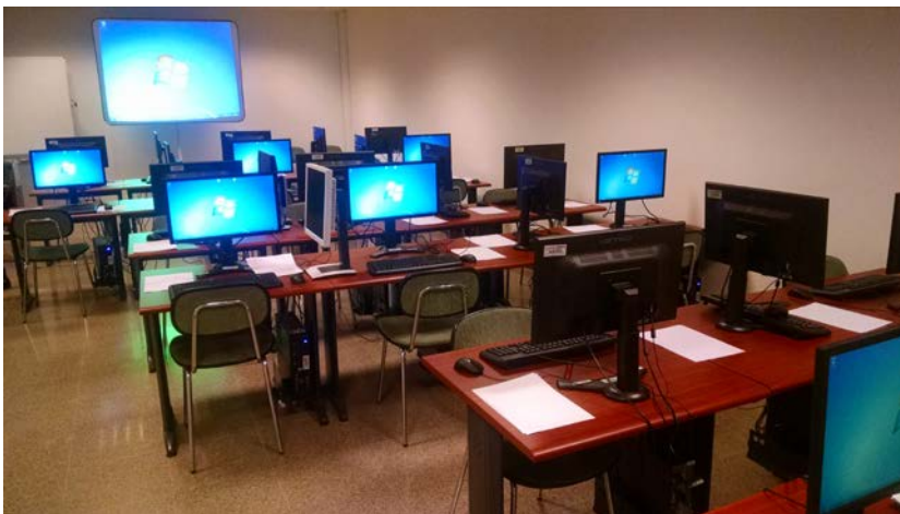
Sala de realización del ejercicio práctico.

A las 16 horas, los secretarios fueron llamando a los opositores que esperaban fuera de la sala. Previamente, se habían preparado 16 memorias USB, numeradas, que contenían la información indicada anteriormente. Los opositores fueron citados conforme al orden establecido en la convocatoria y fueron extrayendo de una caja, al azar, su correspondiente memoria USB. Hay que decir que el número que aparecía en cada memoria se correspondía con uno de los equipos que se encontraban numerados en la sala. Dichos equipos estaban enfrentados y con la suficiente distancia entre ellos para permitir la privacidad en la realización del ejercicio. Los equipos se encontraban completamente limpios de información y desconectados de la red y se contaba con varios de reserva así como con un sistema de alimentación ininterrumpida.