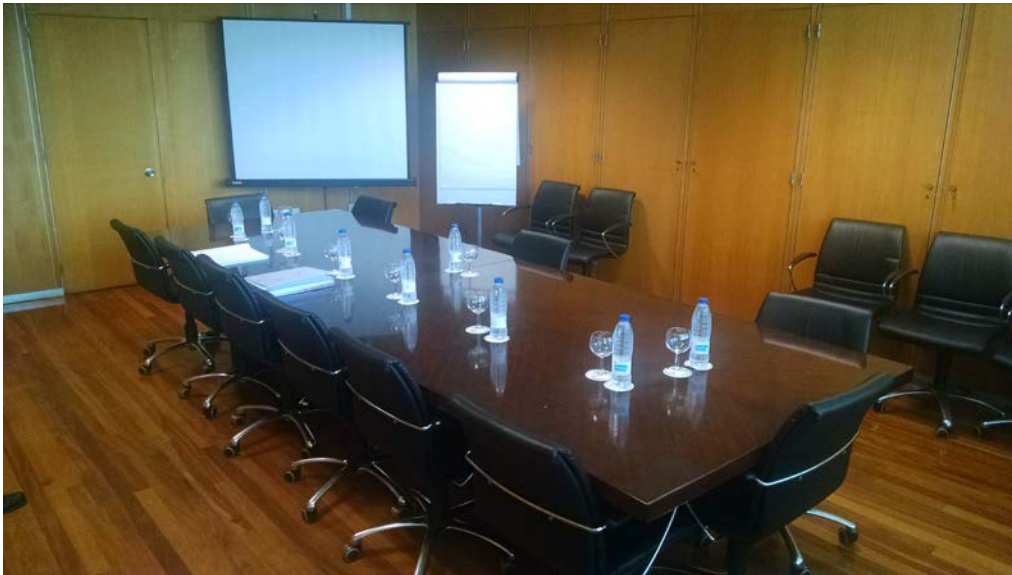
Sala 9.09 de exposición del cuarto ejercicio

Así de esta manera, se fueron desarrollando cada día las exposiciones de los temas y al finalizar, el Tribunal dialogó con cada aspirante durante diez minutos sobre cuestiones relacionadas con los temas que se expusieron. Tan solo uno de los opositores, después de la extracción de los temas, comunicó al Tribunal que se retiraba del proceso.