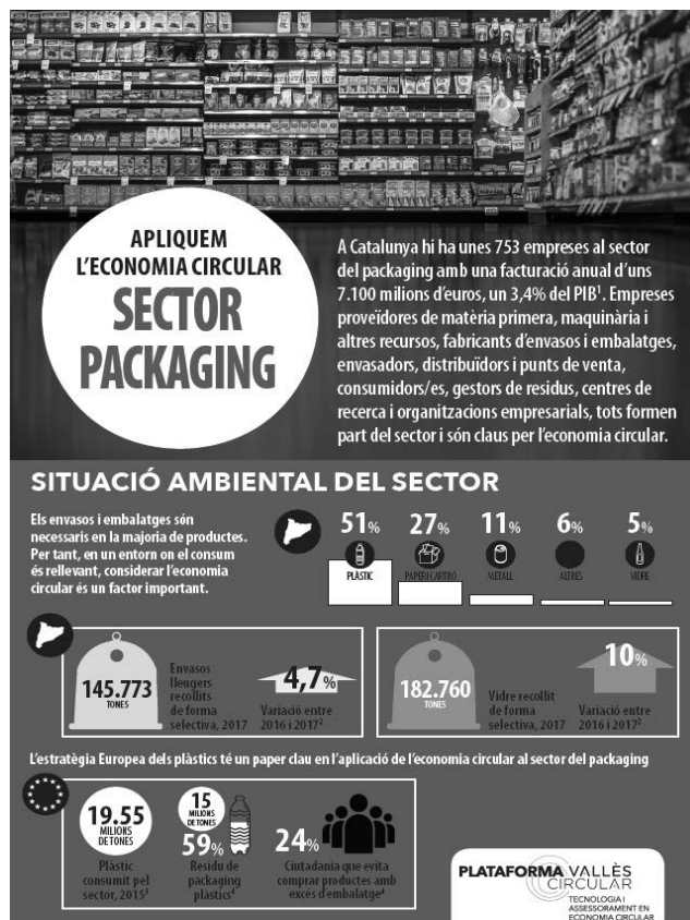
FIGURA 1 PORTADA DEL FOLLETO SECTORIAL DEDICADO AL SECTOR DEL PACKAGING