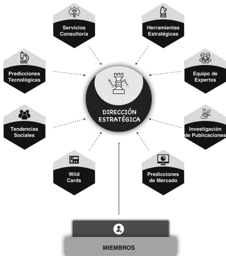
FIGURA 1 PROSPECTIVA INDUSTRIAL AL SERVICIO DE LA DIRECCIÓN ESTRATÉGICA DE UNA EMPRESA